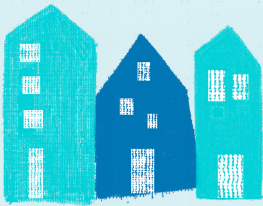
Illustrazione da parte di Romano Turrini (storico) e Responsabili accoglienza rifugiati (Coop. Arcobaleno)

A cura del Comune di Dro, Comitato S. Antonio Dro, Associazione "Ora insieme" Parrocchia di Dro e Drena.